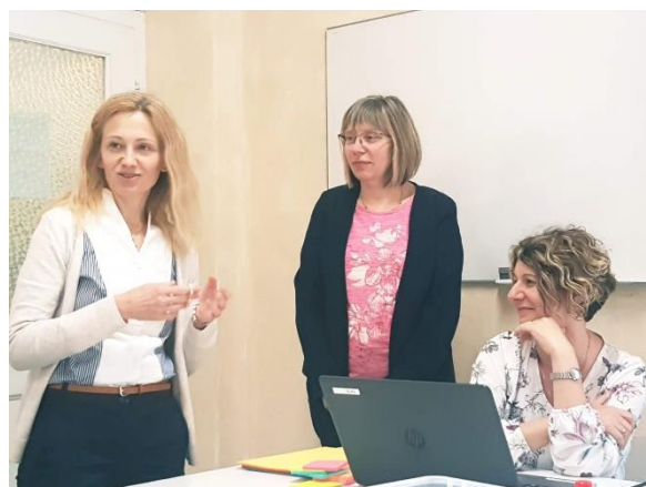
Slika 1 i 2: Predstavljanje našeg grada i škole