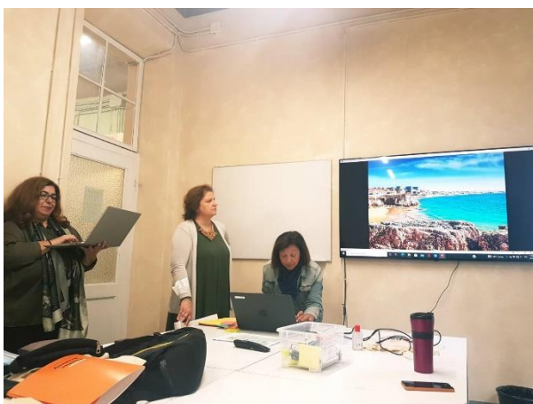
Slika 3: Predstavljanje učesnica iz Portugalije