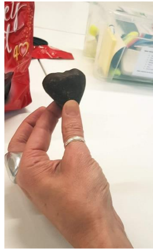
Slika 5: Subotičko „Medeno srce“ u srcu Firence